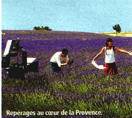
Repérages au cœur de la Provence.